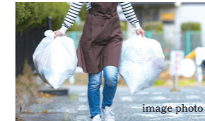
いつでも24時間ゴミ出しOK