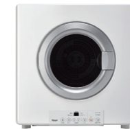
ガス衣類乾燥機 (標準装備)